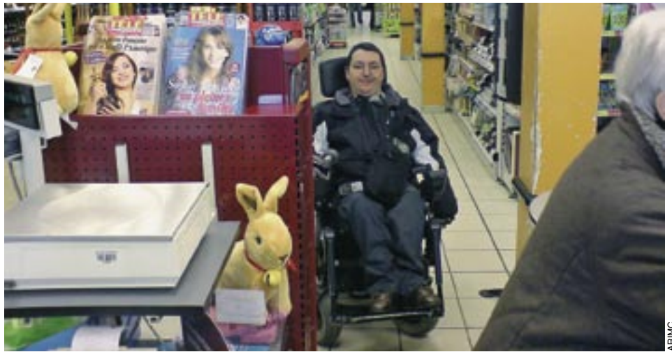
Dans la file d'attente de Monoprix.

Je ne vous raconterai pas ce qui s'y est dit et échangé, mais le dimanche soir, lors du retour en train, j'ai eu envie de noter mes réflexions à chaud et j'ai envie de vous en faire part aujourd'hui car je trouve qu'elles s'actualisent tous les jours dans le