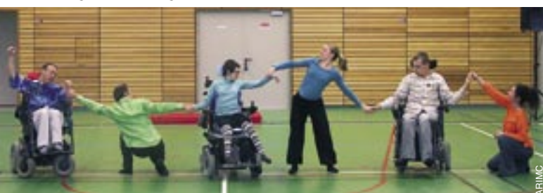
Le groupe au gymnase de Dommartin.