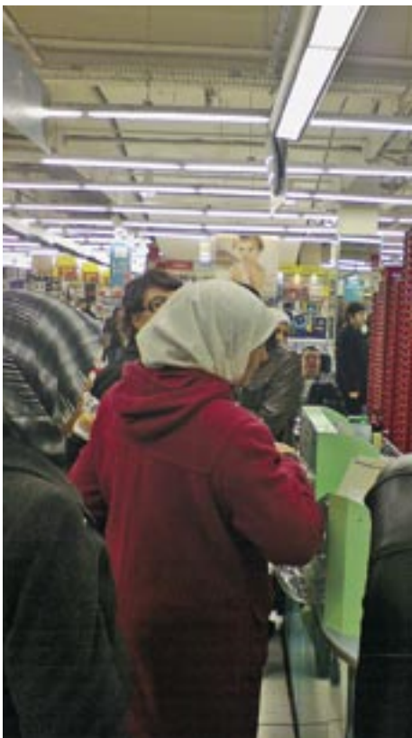
Dans la file d'attente de Carrefour.

» Jérôme Corderet « Pôle ouvert/Le Petit Moncey