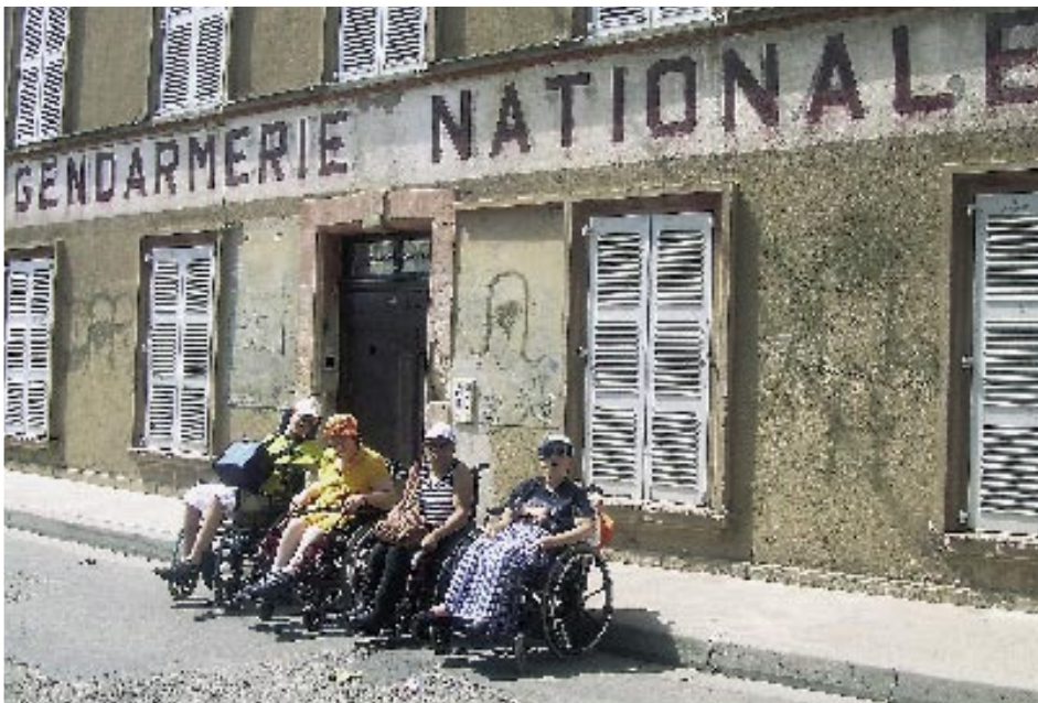
La relève des gendarmes de Saint-Tropez.