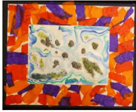
Le feu de la terre...