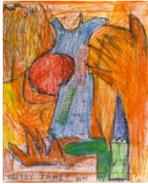
Un feu, l'incendie, je l'imagine en peinture...